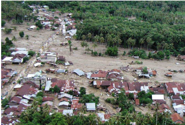
Kutacane, Aceh Tenggara, 20 Oktober

Kira-kira 1,500 pengungsi ditempatkan dalam stadion olahraga dengan fasilitas air dan sanitasi yang tidak memadai. IFRC/PMI melakukan tanggapan awal dengan memberikan masing-masing 400 tenda ukuran keluarga, kain terpal, peralatan memasak dan parcel makanan pelengkap serta 1,200 selimut, diikuti langsung oleh pertolongan tambahan dengan bantuan logistik oleh IFRC dan IOM sebagai berikut: