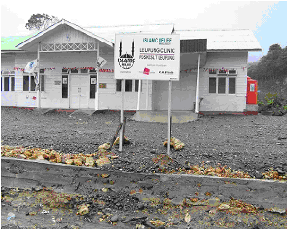
Gambar 4.4. Pusat Kesehatan Satelit

Sampai saat laporan ini disusun, sejumlah rumah sakit unit-unit kesehatan yang rusak berat seperti RS Zainal Abidin, RS Jiwa, RS Malahayati di Banda Aceh, RS Tjut Nyak Dhien Meulaboh sudah dapat beroperasi kembali secara normal. Walaupun rumah sakit telah melaksanakan tugasnya, ternyata sejumlah rumah sakit (RS Zainal Abidin, RS Jiwa, RS Fakinah) belum menerima anggaran kegiatan operasional seperti uang makan, insentif, honor pegawai, dan honor non pegawai per tiga bulan selama tanggap darurat. Disamping itu, juga belum disalurkan biaya kegiatan operasional rumah sakit lain yang menjadi rujukan (RSUD Dr Zainal, RSU Tjut Nyak Dhien, RSU Lhokseumawe, RSU Langsa, RSU H. Adam Malik, RS DR. Pirngadi Medan, RS Jiwa).