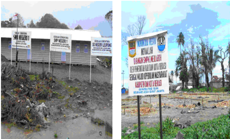
Gambar 4.3. Sekolah Darurat dan Pembangunan Sekolah