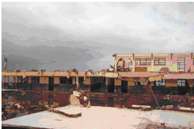
Gambar 2.3. Sekolah yang Hancur terkena Tsunami

Kondisi SMP Negeri 5 Banda Aceh yang hancur, sehingga harus dibangun kembali. (25 Februari 2005)