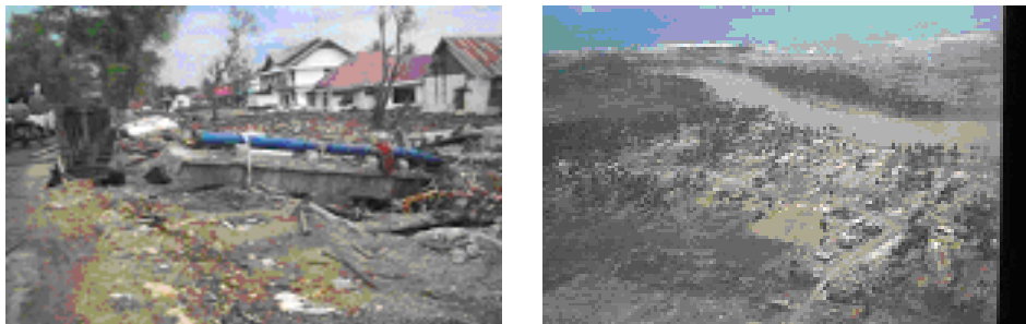
Gambar 4.5. Kerusakan Infrastruktur