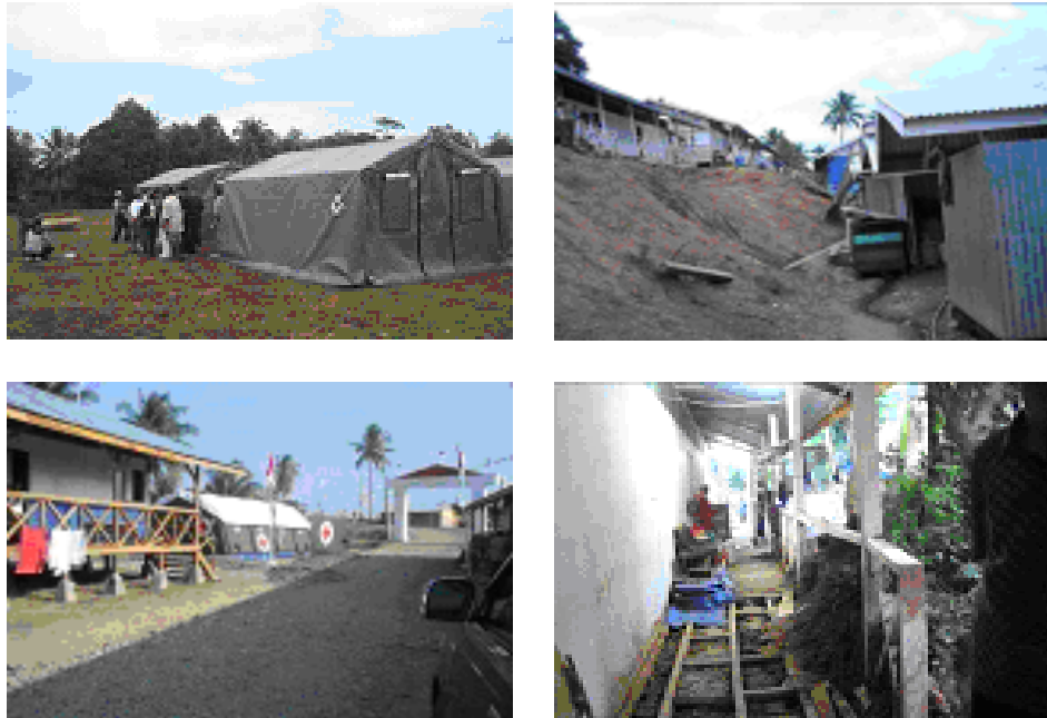
Gambar 4.2. Kondisi Barak-Barak Pengungsi