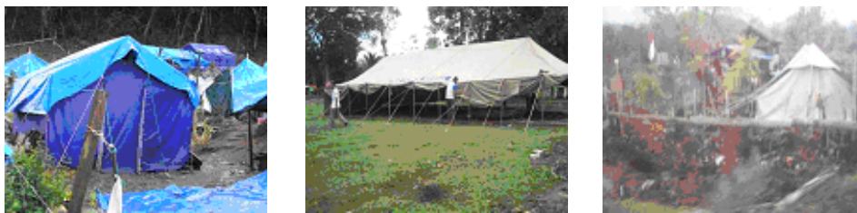
Gambar 4.1. Kondisi Tenda-Tenda Pengungsi