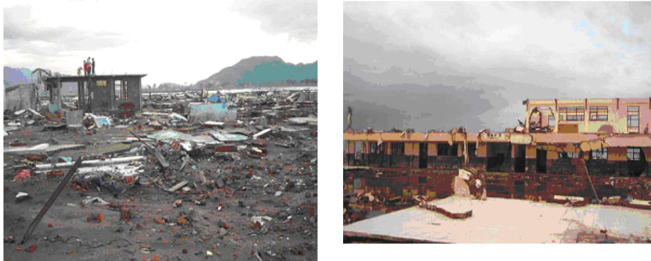
Gambar 2.2. Kondisi Kerusakan Infrastruktur di Ulee Lheu

Tengah 1 jiwa), sementara di Provinsi NAD 42 jiwa (Kabupaten Simeulue 22 jiwa, Kabupaten Aceh Singkil 16 jiwa, Kabupaten Aceh Selatan 3 jiwa dan Kabupaten Aceh Timur 1 jiwa).